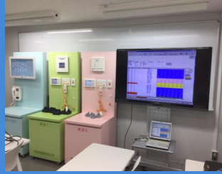
模擬診察室・患者ロボット