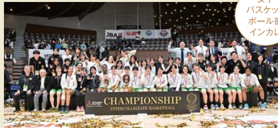
女子バスケットボール部インカレ