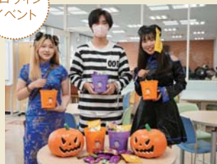
ハロウィンイベント