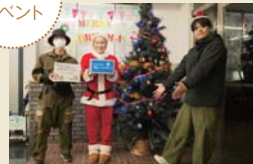
クリスマスイベント

クリスマスが近づくと校友会がキャンパスにクリスマスの飾りつけを行う他、サンタがお菓子を学生に配布します。