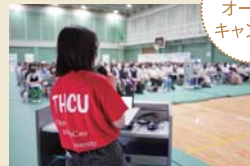
夏のオープンキャンパス

毎年恒例の学生有志による団体スポーツ交流イベントです。競技優勝者への賞品と別に、参加者全体にも抽選会が行われますので運動が苦手な方も友人とご参加ください。