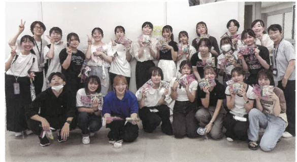
右) MVP! おめでとう! 下) 優勝チームのメンバーで