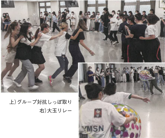
上) グループ対抗しっぽ取り 右) 大玉リレー

玉リレー、大玉の空気をいち早く抜く大玉空気抜きにグループで協力して取り組み、屋内とは思えぬ盛り上がりを見せました。終了後は、写真撮影や連絡先の交換など、学年を超えて交流する姿が見られ、有意義な会となりました。