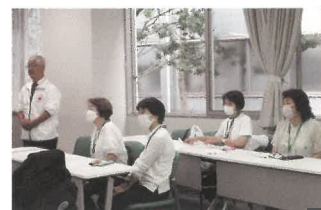
立川市赤十字奉仕団 委員長、副委員長、支部委員の皆さん