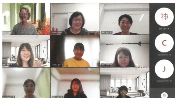
学ぶことが多かった講義も楽しく!