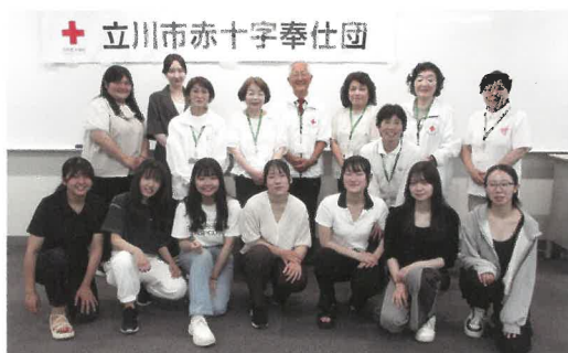
(前列) 新入団のメンバー (後列) 看護学生奉仕団リーダー、立川市赤十字奉仕団の皆さん

生)からは、本学メンバーの紹介、活動状況の説明、今後のスケジュールなどを含めて、きめ細かいアドバイスが後輩メンバーに発信されました。本学の看護学生奉仕団は新入団を含めて総勢34名になり、各支部の防災訓練、献血支援、赤十字ボランティアフェスティバル、立川警察署主催のイベントでの応急救護・携帯トイレ・非常食などの展示説明・体験訓練などに活躍しております。