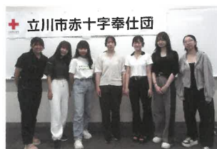
新入団のメンバー