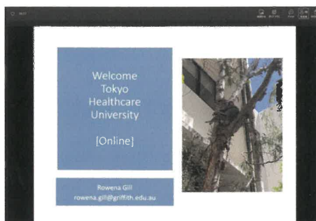
グリフィス大学での最初の授業、コアラのお出迎えです!

長い夏休みが有意義に、英語がブラッシュアップできた、将来海外で仕事をしたいからとても興味深かったなど、さまざまな声が聞かれました。この研修で得たことは、きっとこれからの学びにも活かされていくことでしょう。