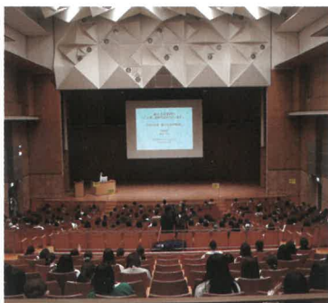
国立オリンピック記念青少年総合センター

コミュニケーション研修では、4学部混合の初対面の学生とのグループワークに最初は緊張の面持ちでしたが、講座終盤には連絡先を交換し合うなど、良い交友関係のきっかけとなる思い出のイベントになりました。