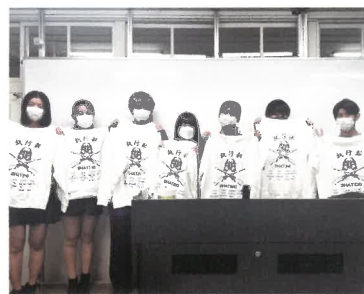
執行部パーカーとともに