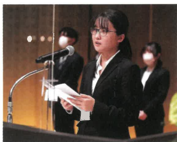
在校生歓迎の言葉

学友会の活動に加わってくれるメンバーを募集中です！ぜひ、一緒にこの大学をさらに盛り上げていきましょう！