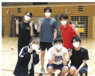
スポーツ大会に執行部として出場