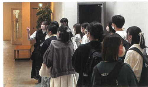
上級生によるキャンパスツアー