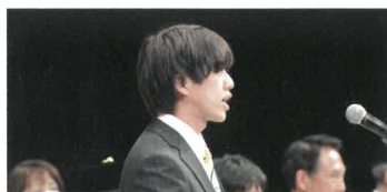
在学生歓迎の言葉