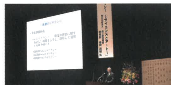
講話「医療のリテラシー～サイエンスとアート～」