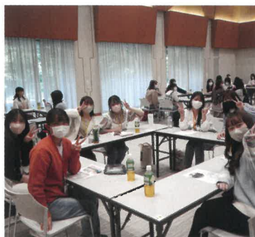
コミュニケーション研修