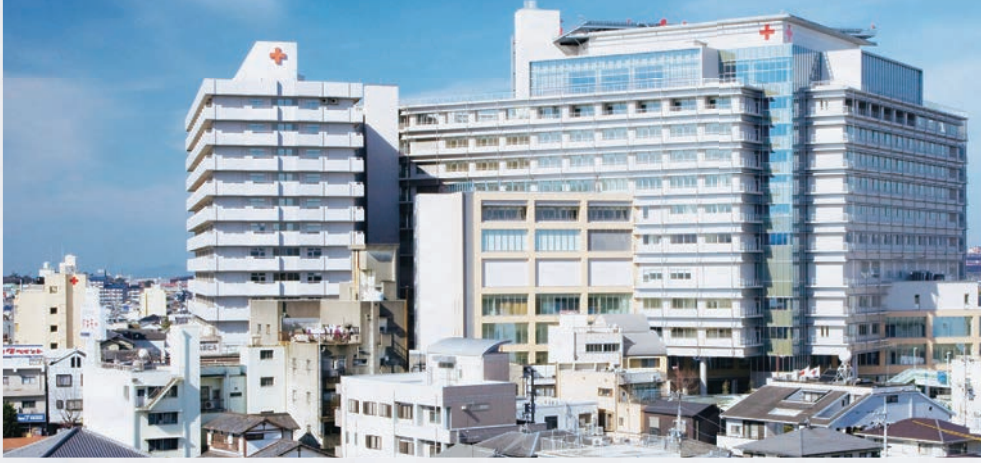
▲2020年4月開設予定の日赤和歌山医療センターキャンパスは日本赤十字社和歌山医療センターに隣接しています。